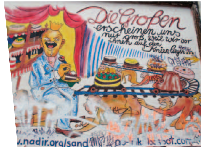
Zeit zum Aufstehen

Wenig erstaunlich war es, dass weder SPD- noch GAL-Fahnen auf der Demo zu sehen waren, trugen oder tragen sie doch beide mit ihren Entscheidungen dazu bei, dass neoli-