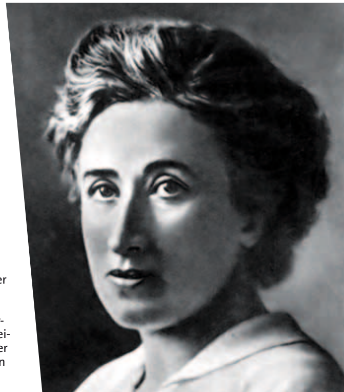
Rosa L.

Rosa: Die Barrikadenschlacht, die offene Begegnung mit der bewaffneten Macht des Staates, ist in der heutigen Revolution nur ein äußerster Punkt, nur ein Moment in dem ganzen Prozess des proletarischen Massenkampfes.