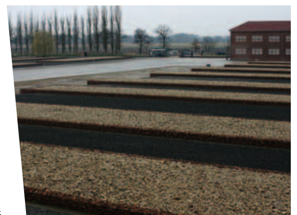
Teil des Programms: Ein Besuch in der Gedenkstätte KZ Neuengamme

Das gegenseitige Kennenlernen wurde dadurch unterstützt, dass die Gäste des Hashomer Hazair in den Familien der Hamburger Jugendlichen übernachteten, es gemeinsame Extremerfahrungen im Klettergarten gab und viel diskutiert wurde.