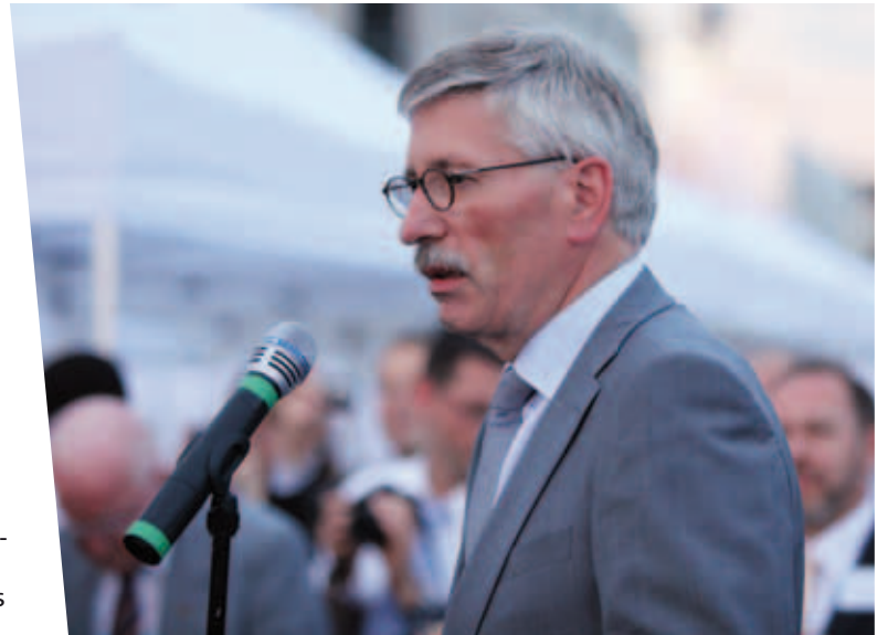
Bildungsverweigerer, ganz ohne Kopftuch

Sarrazin stellt die Situation so dar, als seien Erwerbslose arbeitsunwillig. Tatsache ist aber, dass die Arbeitslosigkeit in den letzten 20 Jahren so stark angestiegen ist, dass mittlerweile auf eine Stelle im Schnitt zehn BewerberInnen kommen. Ebenso stellt Sarrazin