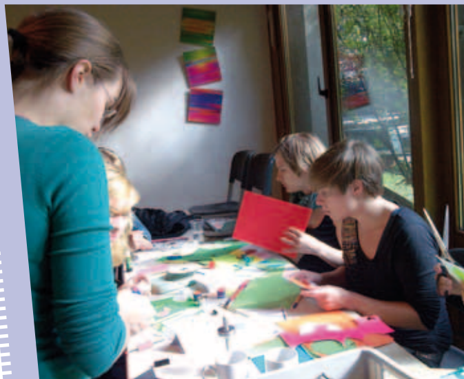
FemPower Seminar der Falken