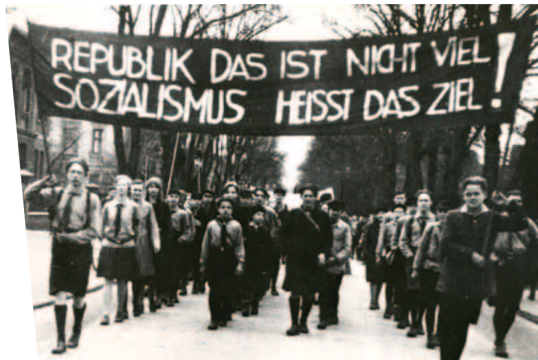
Auftritt einer Gruppe der Sozialistischen Arbeiterjugend (SAJ) beim Nordwestdeutschen Jugendtag in Lüneburg, 20./21.4.1930. Die SAJ war eine Vorgängerorganisation der SJD – Die Falken. Der Slogan des Transparents und das Auftreten in Uniform war damals ein linkes Oppositionsphänomen, das im Verband heftige Kritik fand.

Die SJD – Die Falken verurteilen die »Volks«-Kampagne. Als politischer Bildungsverband fühlen wir uns zu Gegenklärung verpflichtet. Kein »Volks«-Plakat darf unbeantwortet bleiben. Alle Gliederungen sind aufgerufen, in Pressemitteilungen