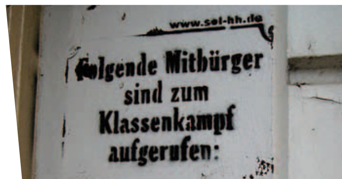
Bist Du dabei?

Du solltest dir schon genau überlegen, wer und was dir wichtig ist. Solidarisch mit den Ausgebeuteten dieser Welt? Oder doch lieber dem Chef in den Arsch kriechen und darauf hoffen, selber mal ein paar Untergebene zu haben?