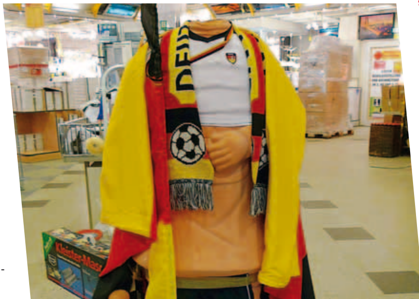
Nation wird gemacht: Mit Gefühl und Kommerz